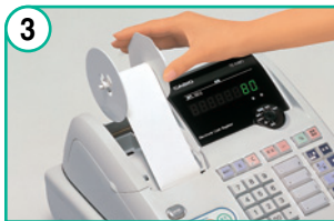
プリンタカバーを閉じたら、ジャーナルカバーを外し、ロールペーパーをホルダーに巻き取りセットする。