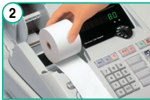
「ドロップイン方式」なので、ロールペーパーを置くだけ。