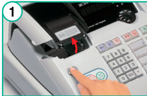
プリンタオープンキーを押して、プリンタカバーを開ける。